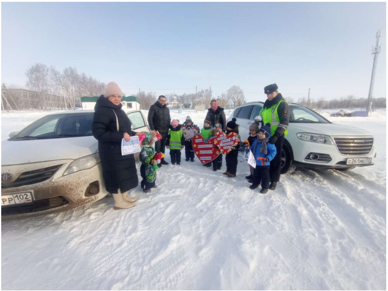
Акция «Сердце безопасности»