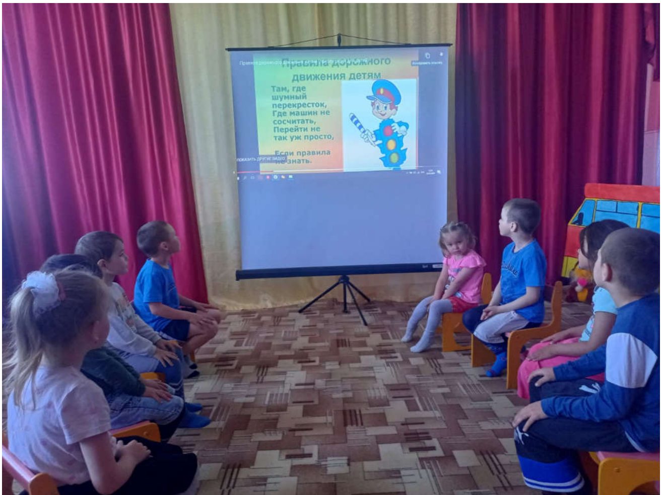
занятие по ознакомлению воспитанников с правилами дорожного движения.