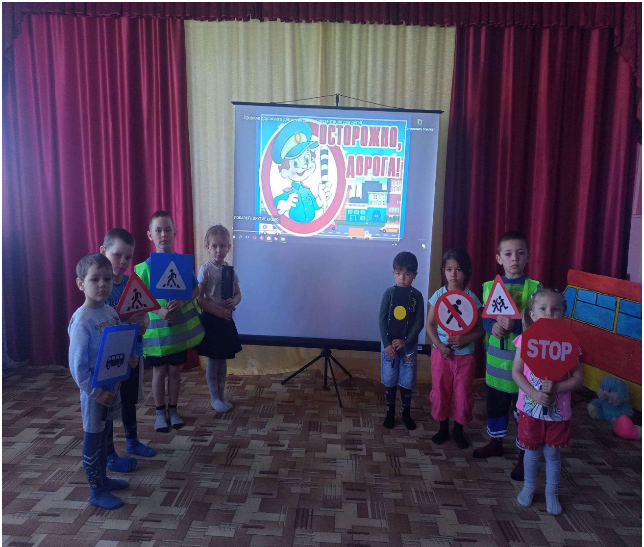
Наши друзья-дорожные знаки