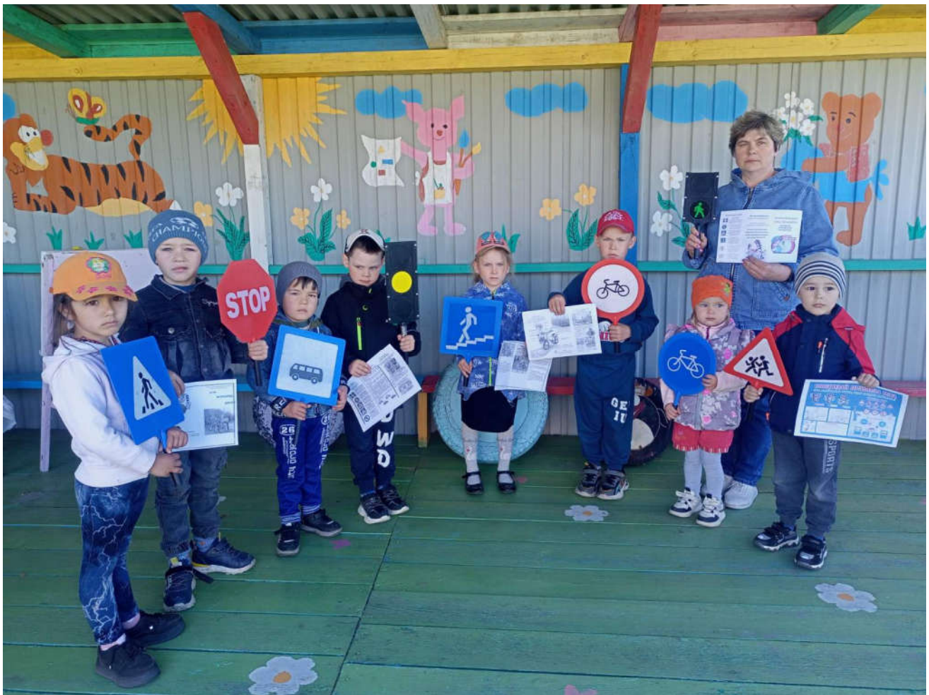
Занятие по ПДД. Правила дорожные знать каждому положено Беседа с воспитанниками Правила езды на велосипеде.