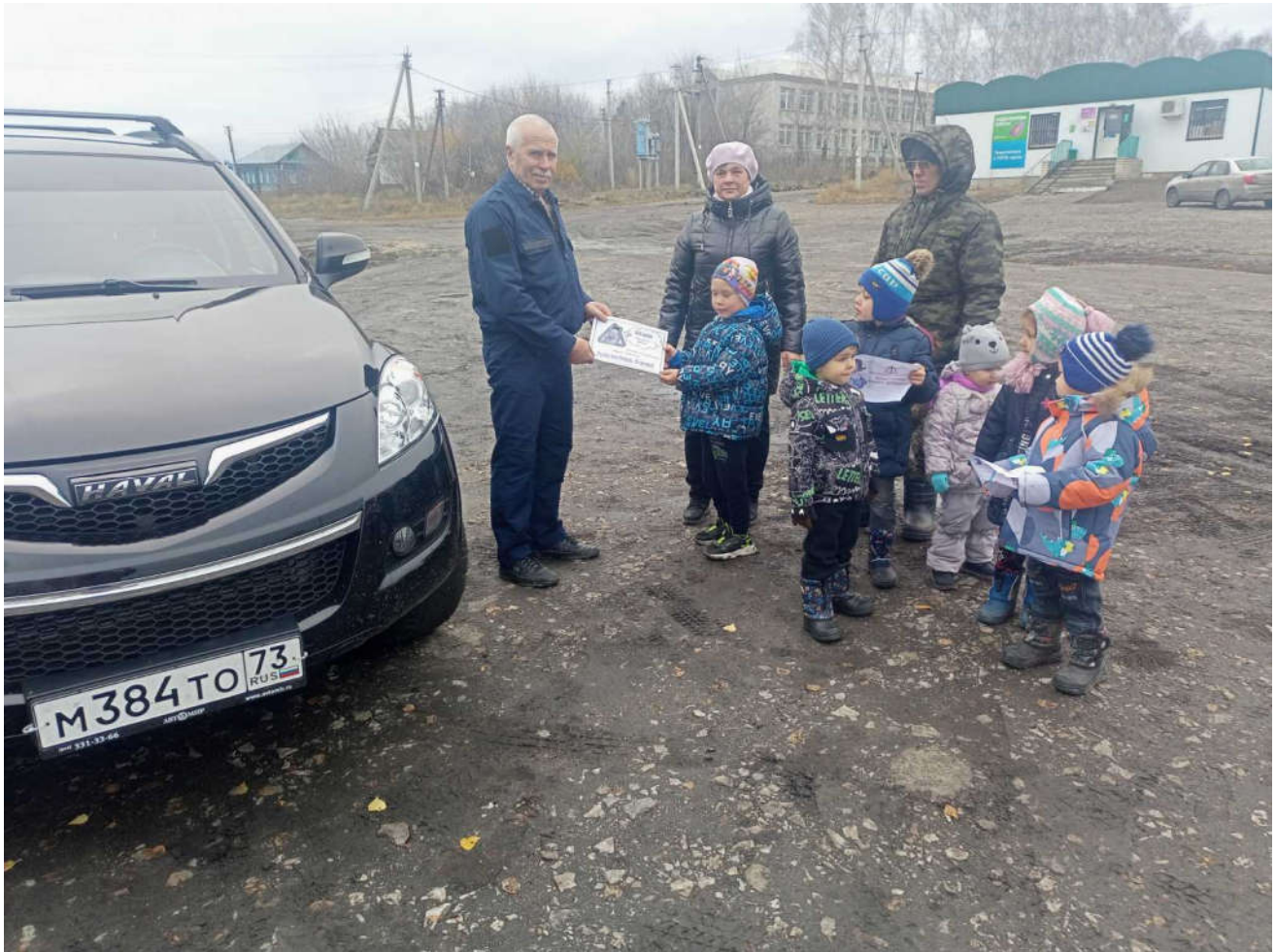
Акция «Пристегни самое дорогое»»