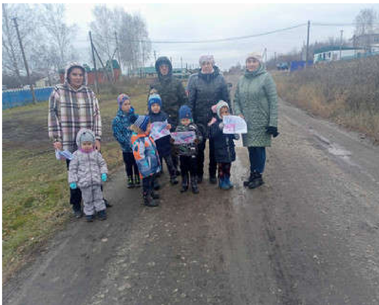
Акция «Умелый пешеход»