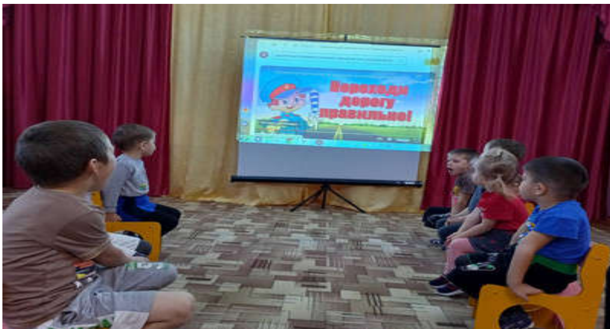
Беседа «Правила маленького пешехода»